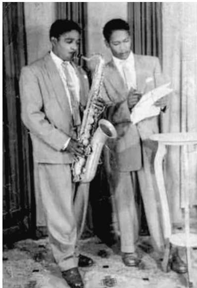
Ernest Ranglin & Roland Alphonso